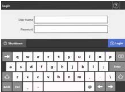
Écran d'ouverture de session

Un kit de développement (SDK) est disponible pour le scanner N7100 afin de toujours mieux répondre aux besoins de votre entreprise. Ce kit permettra le développement d'un connecteur dans une application tierce privilégiée, qu'il s'agisse d'un système DMS, ECM, BPM ou ERP. Ce connecteur est à son tour chargé sur le N7100 et agit comme une porte d'ouverture dans les systèmes de production ciblés. Le kit SDK permet, en outre, l'utilisation de lecteurs de cartes à puce connectés sur le port USB du scanner réseau.