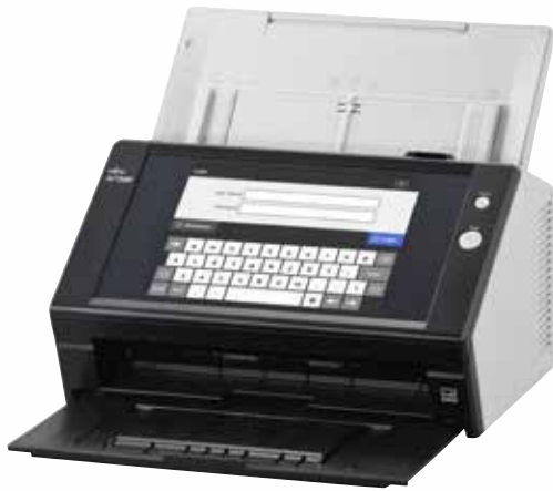
A4 Portrait à 300 dpi 25 ppm / 50 ipm Scannez lots mixtes jusqu'à 50 feuilles