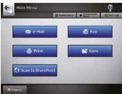
Écran du menu principal