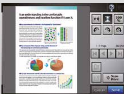
Écran visionneur de Scan